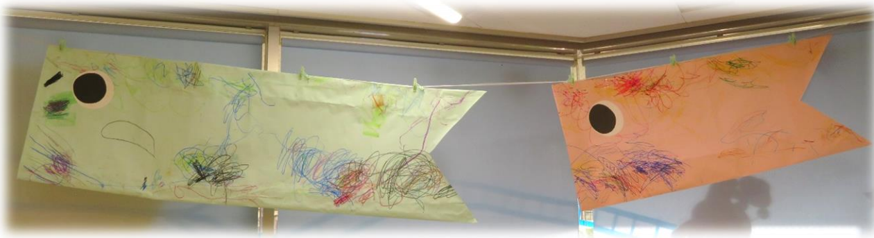
共同製作 (左)2歳児「クレヨン」 (右)1歳児「水性ペン」